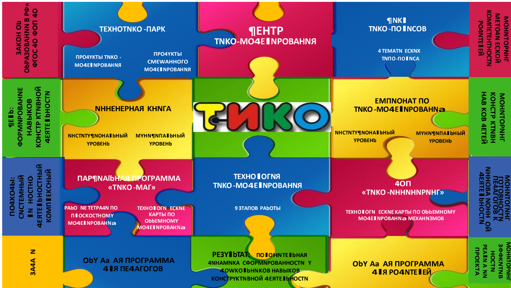
Рисунок 2. Организационно-деятельностная модель системы формирования конструктивных навыков детей старшего дошкольного возраста